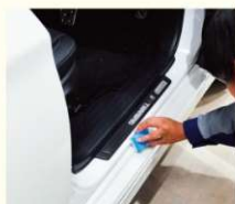
⑥ドア内側のステップ部分