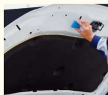
⑦ボンネットの裏側