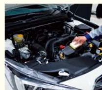
⑩エンジンルームの中